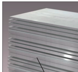
STRUCTURE 3 PLAQUES D'ALUMINIUM ASSEMBLÉES

La 3ème couche est constituée de l'assemblage de plusieurs plaques d'aluminium de fine épaisseur. Elle communique les valeurs, le savoir-faire et la force de Huguenin-Sandoz et également le positionnement du produit présenté.